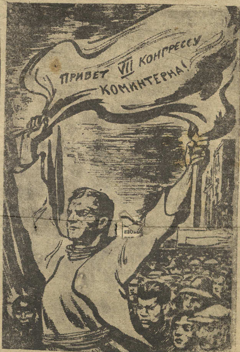
Рис. худ. И. Толдее.

Выступлением тов. Кашена закончилось вечернее заседание 27 июля.